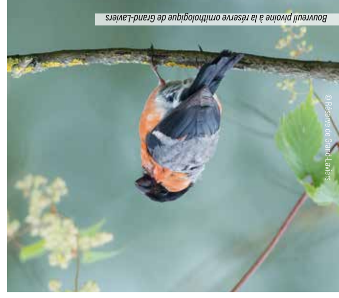
Bouvreuil pivoine à la réserve ornithologique de Grand-Laviers