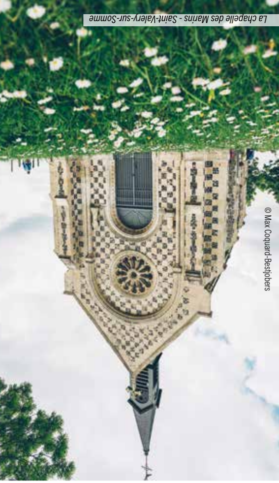
La chapelle des Marais - Saint-Valery-sur-Somme