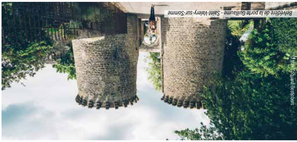
Belvédère de la porte Guillaume - Saint-Valery-sur-Somme