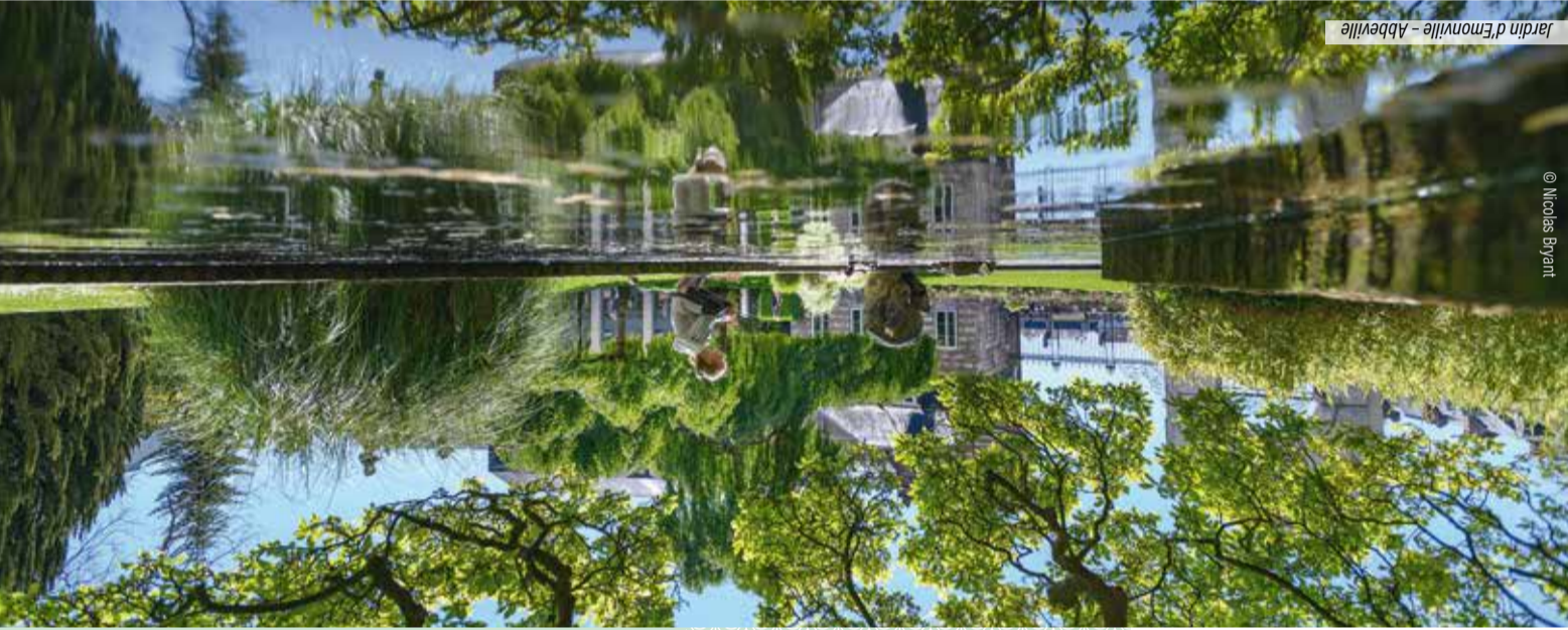
Jardin d'Emonville - Abbeville