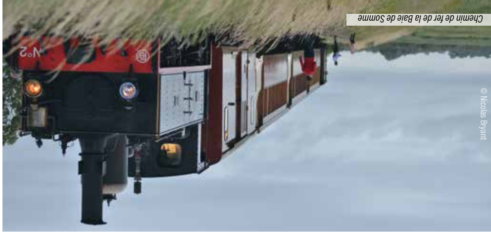
Chemin de fer de la Baie de Somme