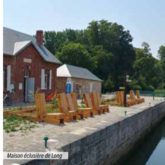
Maison éclésièrre de Long