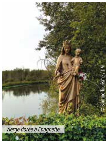
Vierge dorée à Epagnette