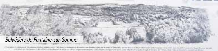
Belvédère de Fontaine-sur-Somme