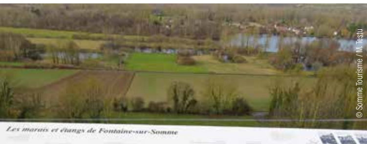
Les marais et champs de Fontaine-sur-Somme