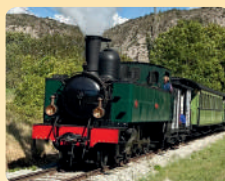
Locomotive 230 Bretonne - GEP