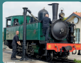
Locomotive 230 Fives-Lille N° E 332 – CFBS