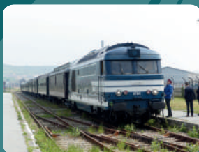
Diesel BB 67400 – PVC