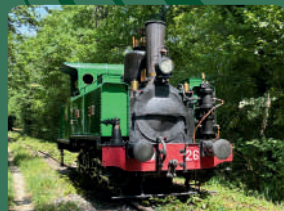
Locomotive 031 Corpet-Louvet La Suzanne