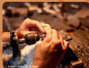
Musée de la Nacre et de la Tableterie