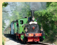
Locomotive 020 n°5844 Henschel « Christiane » - CFTR