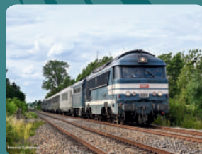
Diesel A1A A1A 68540 – AAATV