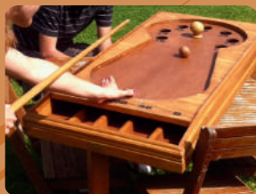
Spiele aus der Picardie