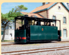
Locomotive 030 bicabine HL 303 - ASV