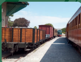
Locotracteur 352 et Rame Marchandises

Reservierung erforderlich, begrenzte Teilnehmerzahl, Kontakt: 03 22 26 93 93