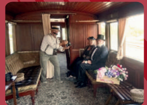
Salon-Wagen von 1889