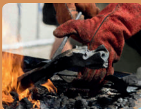
Veiren "Les Fers Savoirs"