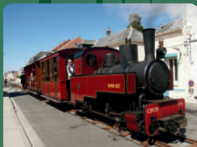
Locomotive 030 Decauville – Appeva