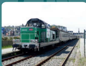
Diesel BB 69432 – MFPN