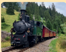
Locomotive G ¼ n°14 baptisée Moidiliana La Traction