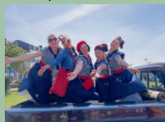
Z'A Crew Pin'up

Show und Einführung in Retro- und Musikatmosphäre.